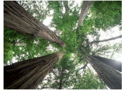
Juntos Todos, Compartiendo